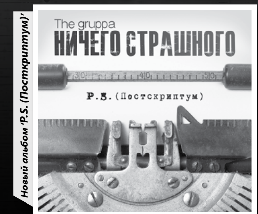
Новый альбом 'P.S. (Постскрипtum)'

Есть ли в планах видеоклипы и что именно,